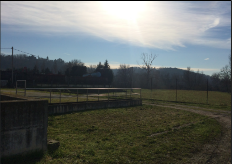
FOTO 5 - stato di progetto